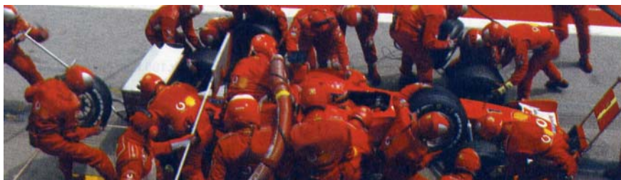
Fig. 1) La formazione è come un pit stop per la Formula Uno: una “sosta” indispensabile da cui dipende in modo significativo l'esito della corsa.

Il “low cost” nella formazione non solo non funziona ma provoca anche danni in termini di demotivazione, insoddisfazioni e sprechi di risorse.